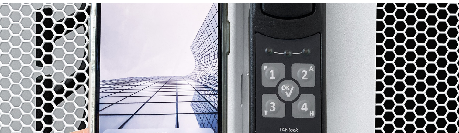
Elektrische Verriegelungen - TANLock 3